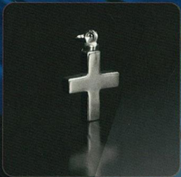
Modelo: CRUZ CUADRADA