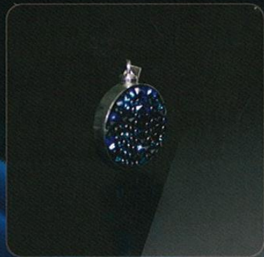
Modelo: SWAROVSKI PEQUEÑO