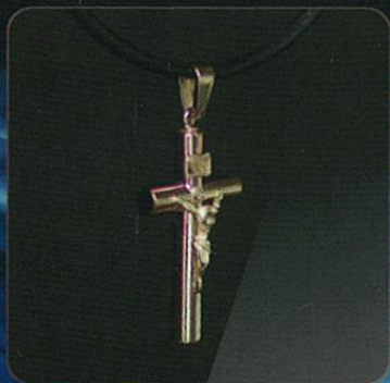
Modelo: CRUZ CON CRISTO ORO