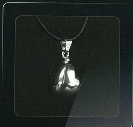
Modelo: CORAZÓN INCLINADO