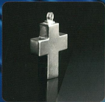
Modelo: CRUZ GRANDE