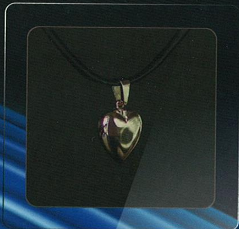
Modelo: CORAZÓN ORO