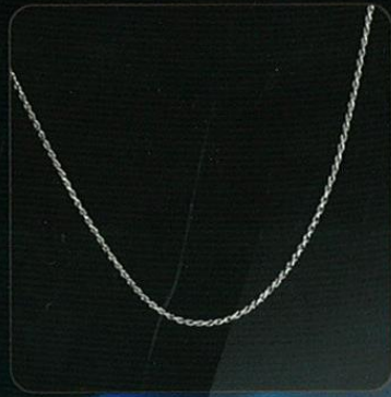
Modelo: CADENA FINA