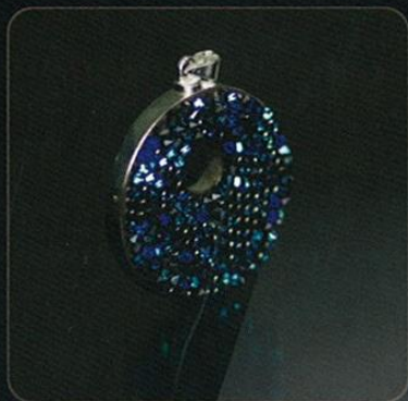
Modelo: SWAROVSKI GRANDE