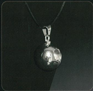
Modelo: LLAMADOR DE ÁNGELES