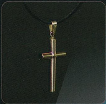
Modelo: CRUZ ORO