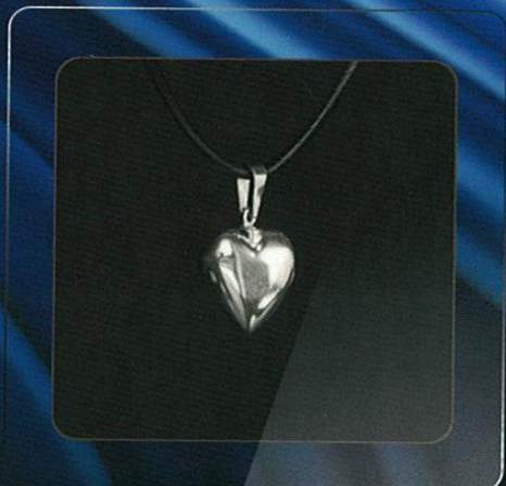
Modelo: CORAZÓN PLATA