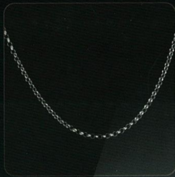
Modelo: CADENA GRUESA